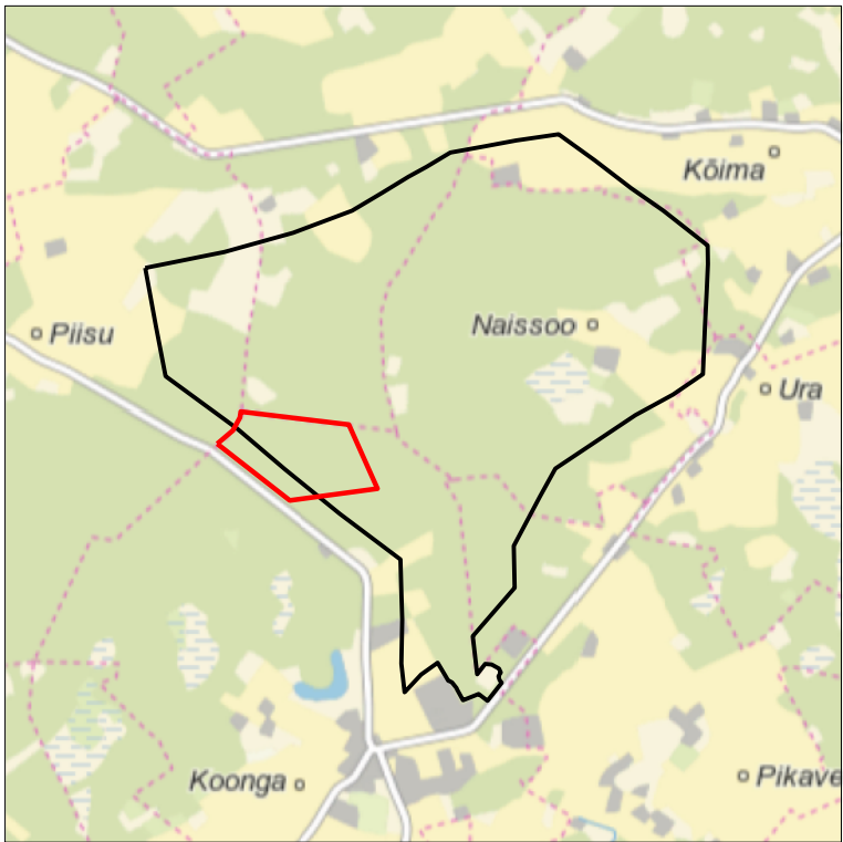
Kaardileht nr 5333 Lavassaare